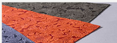
人工皮革と合成皮革