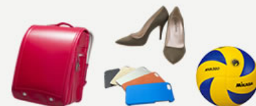
<クラリーノ>の歴史